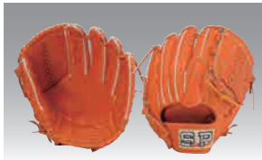
■ 投手用 A