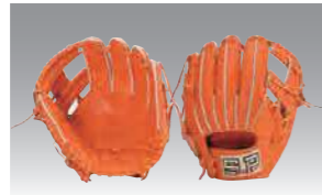
■ 二塁手・遊撃手用